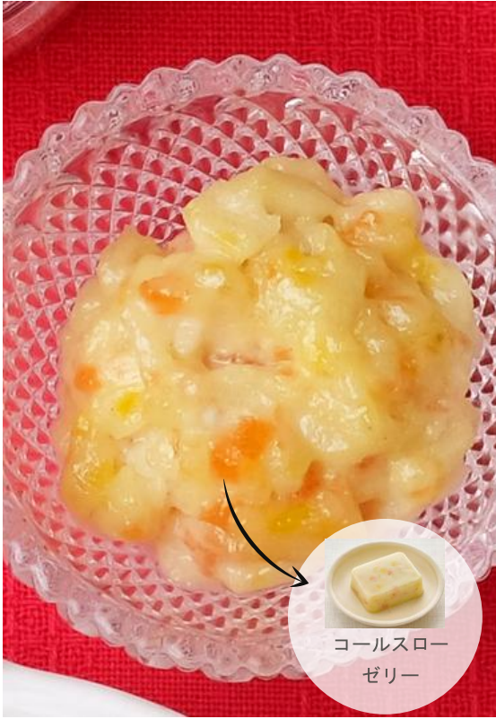
コールスロー ゼリー