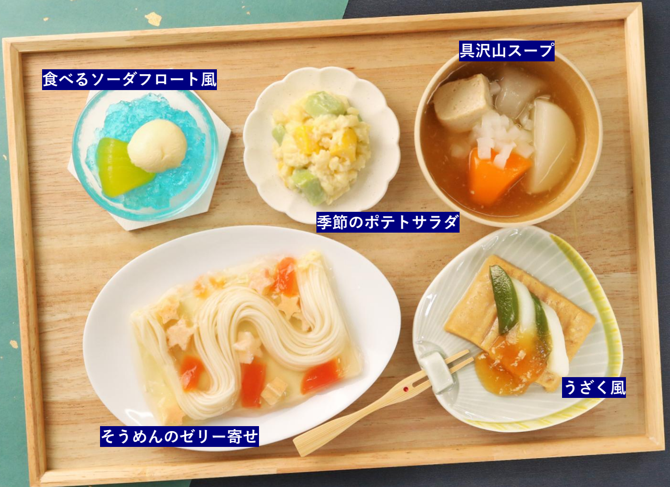
食べるソーダフロート風